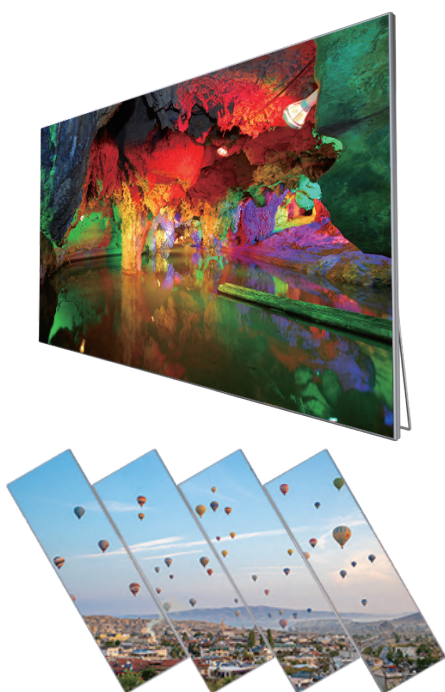
マルチスクリーン / 壁掛け

www.cima-net.co.jp/led/cima-led-vision.html