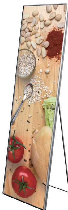
スタンド据え置き