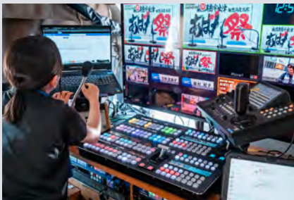
オペレーション卓

https://www.cima-net.co.jp/case-study/event/17893