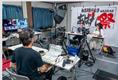
特設スタジオの様子