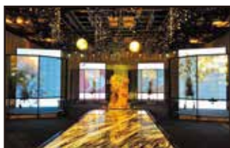
縦11×横6面タイル 4セット

1タイルは約9.2kgと片手で持てる重さであり、デザイナーの意図したユニークなサイズと形状に素早く設置できます。